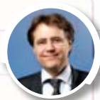
Serge GROUARD Maire d'Orléans, Député du Loiret

Vous espérant satisfaits de ces actions, nous vous souhaitons à tous, parents et enfants, une bonne rentrée 2008.